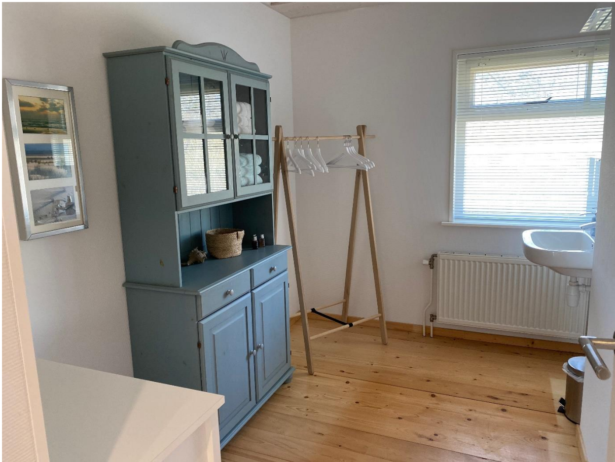
Slaapkamer welke momenteel gebruikt wordt als kleedkamer.